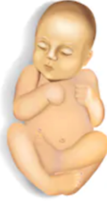
طفل مصاب بحالة شديدة من الصفراء